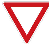
P 4 Dej přednost v jízdě!

Vodorovná dopravní značka „dej přednost v jízdě“ a navazující přejezd pro cyklisty naznačuje, že se má cyklista rozhlédnout a jet. Stačí však napadané listí nebo sněhový poprašek, a značka náhle zmizí. Doplnění svislé dopravní značky „P04“ by tak bylo určitě více než na místě.