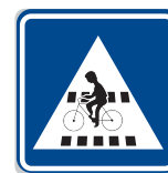
IP 7 Přejezd pro cyklisty

Stejné místo, jiný úhel pohledu. Zatímco řidič je informován značkou IP06 o tom, že se před ním nachází jen přechod pro chodce, tak ve skutečnosti přejíždí i přejezd pro cyklisty. Pokud tedy řidič uvidí jedoucího cyklistu, může se mylně domnívat, že porušuje předpisy tím, že přejíždí na kole po přechodu. Měla by zde být doplněna značka IP07.